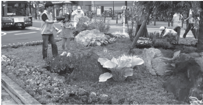
国際電気テクノサービス(株)による花小金井駅前ロータリーの植栽活動

これら地域の環境活動を通じ一人ひとりの意識と力を結集し、地球規模の環境問題を解決していく力となるよう、これからもさまざまな環境活動に取り組みます。