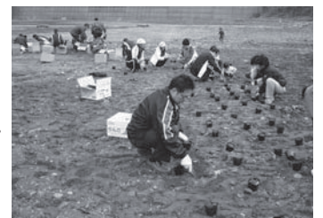
雲仙・普賢岳のふもとに芝桜を植栽

当日は地元ボランティアおよび雲仙地区の工事業者50名の方々と色とりどりの芝桜を山のふもとに植栽しました。地域を花で満たし、元気になった島原の方々をこれからも応援していきたいと思えます。