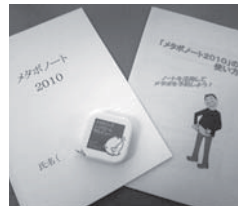
データ記録ツール

適正な生活習慣の定着を図り、生活習慣病予防に取り組むことを目的とした秋田県の「若年者メタボ対策実践・検証事業」へ(株)五洋電子から91名が協力しました。検証内容は各自が「食事・運動・生活」に関する目標を設定した「メタボ予防ガイド」を6か月間にわたり実践し、その達成度や体重・腹囲の測定を毎週記録するものです。データは秋田大学病院で分析され、生活習慣病予防や健康増進を図るために役立てられます。