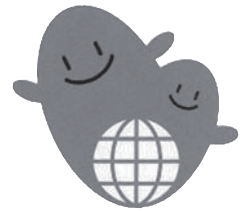
富山県リサイクル認定シンボルマーク

*1 3R: Reduce(リデュース)減らす、Reuse(リユース)再利用、Recycle(リサイクル)再資源化